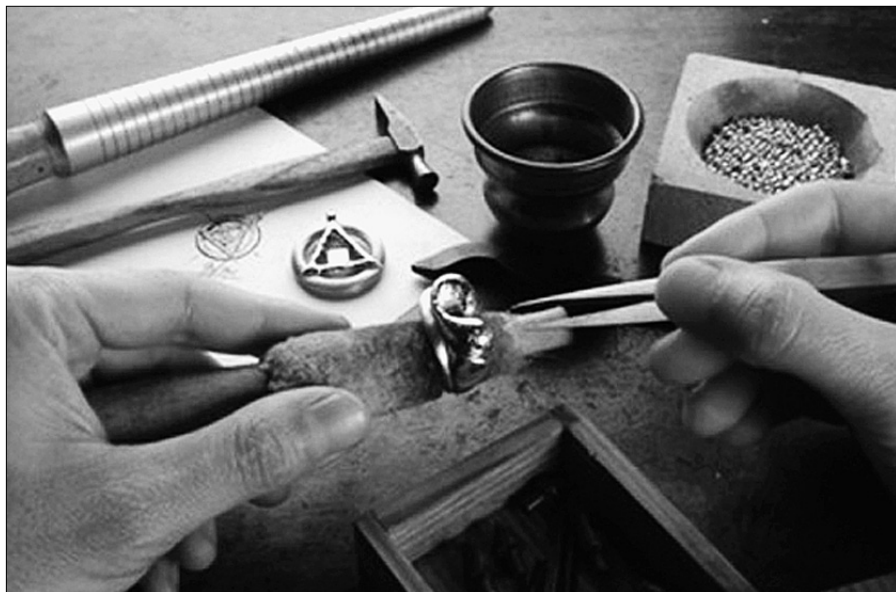
Un artigiano orafo impegnato in un lavoro di precisione

NOVI LIGURE - Il Comune di Novi Ligure, in qualità di Comune capofila del progetto "Giovani, lavoro e territorio", promuove un bando finalizzato all'assegnazione di otto tirocini formativi e di orientamento e/o di inserimento lavorativo da destinare ai giovani disoccupati di età compresa tra i 18 e i 24 anni residenti o domiciliati in uno dei Comuni partner del progetto: Novi Ligure, Arquata Scrivia, Basaluzzo, Pozzolo Formigaro e Serravalle Scrivia. Il progetto, approvato dalla Provincia di Alessandria Assessorato alle Politiche Giovanili, con la partecipazione finanziaria della Regione Piemonte, è rivolto in particolare al settore dell'artigianato per assicurare valide esperienze lavorative presso botteghe e imprese artigiane di qualità e sotto la guida diretta di Maestri Artigiani.